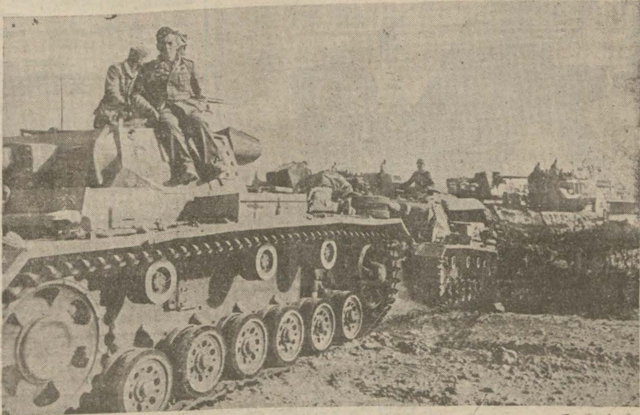
Şimalî Afrikada bir Alman ağır tank koçu