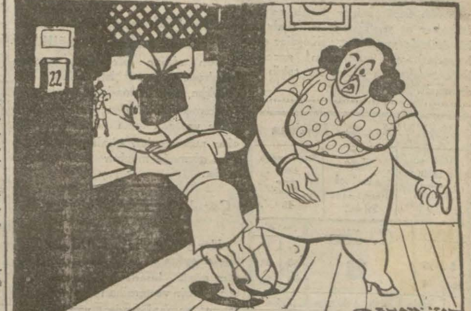
Belediye çöpcülere altı tahta ayakkabılar giydirecek — Gazetelerden — Haydi bak kızım, çöpcünün sesi geliyor. Mutfaktaki tenekeleri kapıya indir. — Anneciğim gelen çöpcü değil, ablam!..

Kiangsi'de de Japonlar, Manchang istikametinde batıya doğru çekiliyorlar. Japonların, buralara girebilmeleri için kullandıkları ana yol olan 700 kilometrelik Kiangsi - Tcheikiang demiryolunu kolayca kontrol edemeyeceklerini anladıklarına şüpheliye yoktur.