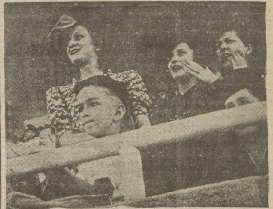
Yarışları heyecanla takib eden bayyalardan bir grup

İstanbul dün de mevsimin en sıcak günlerinden birini yaşamıştır. Şehrin bazı mntakalarında hararet derecesi 35 i bulmuş, sıcağın bu mntakalar sahillere akın etmiştir. Adalara, Boğaziçine, Floryaya ve diğer sayfiye yerlerine işleyen vapur ve trenler dün çok kalabalık olmuş, hemen bütün İstanbul halkı bu yerlere taşınmıştır. Şirketleri Hayriye idaresi dün fazla kalabalık yüzünden mutad tarife haricinde Köprüden Boğaza müteaddid zühurat postaları kaldırılmıştır. Dün yalnız Boğaziçine 70 bin kişi gitmiştir. Floryaya da ilâve trenleri kaldı. (Devamı 5 inci sayfa)